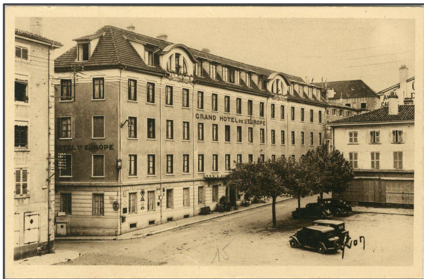
Figure 1 : Carte Postale de l'Hôtel de l'Europe (1940)

Alors que le Régime de Vichy interdit toute commémoration, des tracts incitent les lycéens à participer à la célébration du 14 juillet 1 1942, qui se tient devant le Monument aux morts. Un rapport de police fait état d'un regroupement de 30 lycéens . Le Lalandais Roger Page est arrêté. Il est passé à tabac dans les sous-sols de l'Hôtel de l'Europe , puis relâché.