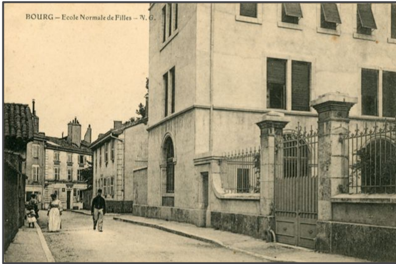
Figure 1 : Photographie de l'Ecole Normale de Filles de Bourg-en-Bresse

En février 1943, la création du S.T.O. ( S ervice du T ravail O bligatoire) entraîne le recensement des jeunes (nés entre 1920 et 1922) dans le but de fournir la main d'oeuvre demandée par l'Allemagne. Ce service inquiète beaucoup, et de nombreux mécontentements se font entendre.