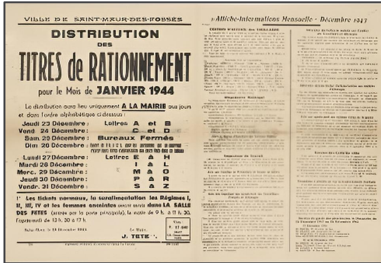
Figura 1: Esempio di buoni di razionamento (1944)

In diverse occasioni, gli studenti del liceo Jérôme Lalande manifestano il loro malcontento nei confronti della politica di Vichy nella mensa della scuola.