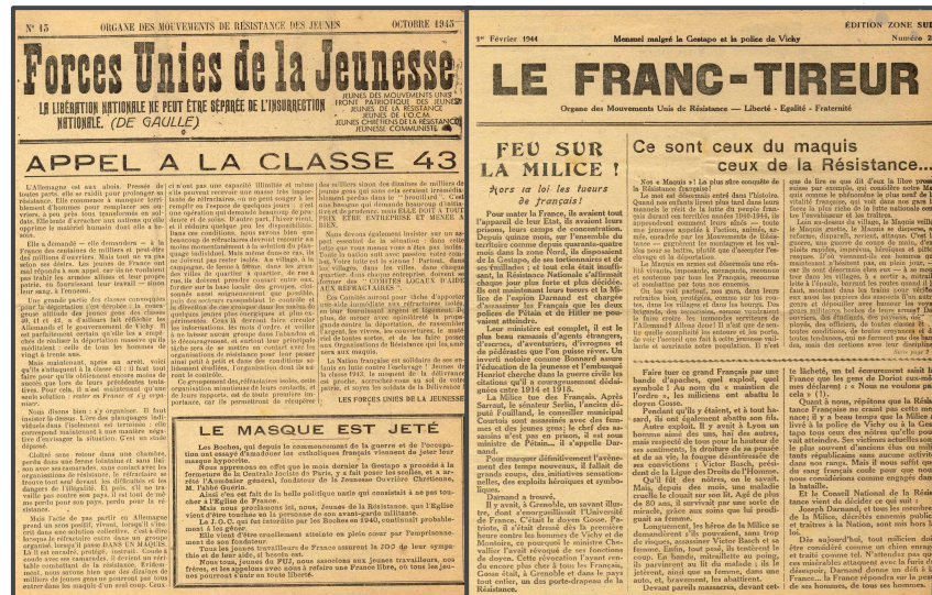
Figura 4: Uno de los periódicos Forces Unies de la Jeunesse (n.º 13, octubre de 1943) y Le Franc-Tireur (n.º 28, 1 de febrero de 1944)

Los estudiantes del instituto no se contentaban con distribuirlo dentro del establecimiento escolar, sino que se encargaban sobre todo de repartir paquetes de periódicos entre sus conocidos cuando regresaban cada semana con sus familias . Además, se introdujeron en el instituto armas y plástico utilizado en la fabricación de explosivos.