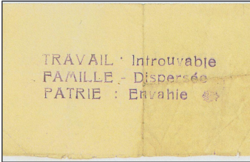
Figura 1: Ejemplo de “papillon” distribuido en el instituto Jérôme Lalande durante la guerra (1941).

Las aulas , donde los alumnos pasaban la mayor parte del día, eran naturalmente lugares de difusión de ideas . Frente a la propaganda del régimen de Vichy difundida por el director, el Sr. Maurer , algunos alumnos intentaron difundir otras ideas. Desde la primavera de 1941, se distribuían discretamente panfletos y " papillons " 1 durante las clases. También se comercializaban retratos del general Charles de Gaulle y cruces de Lorena .