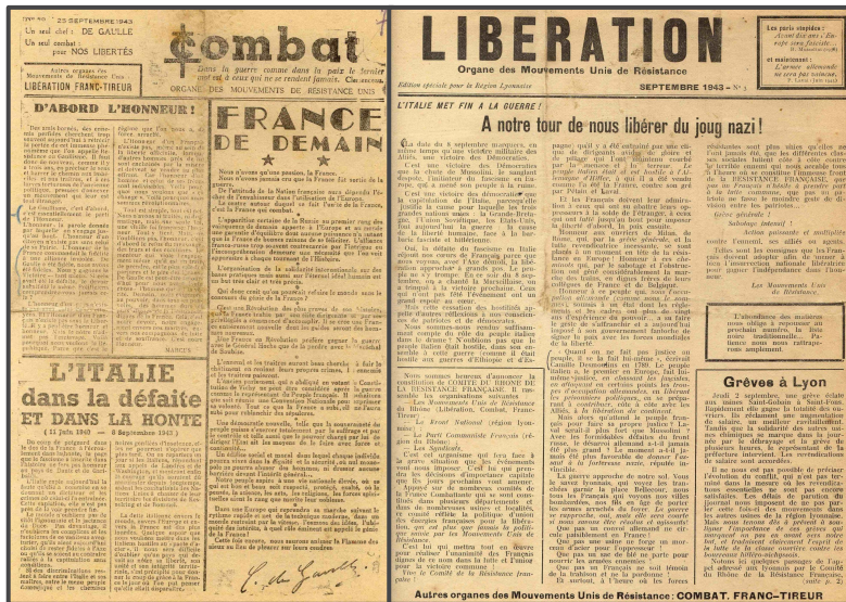
Figura 3: Dos de los periódicos de la resistencia Combat (n.º 3, 22 de septiembre de 1943) y Libération (n.º 3, septiembre de 1943).

Tras varias visitas, los tres se dieron cuenta de que compartían el mismo deseo de continuar la lucha . El comerciante le proporcionó periódicos clandestinos y fotografías del general De Gaulle . Una vez en el instituto, los alumnos se los pasaron a compañeros de confianza.